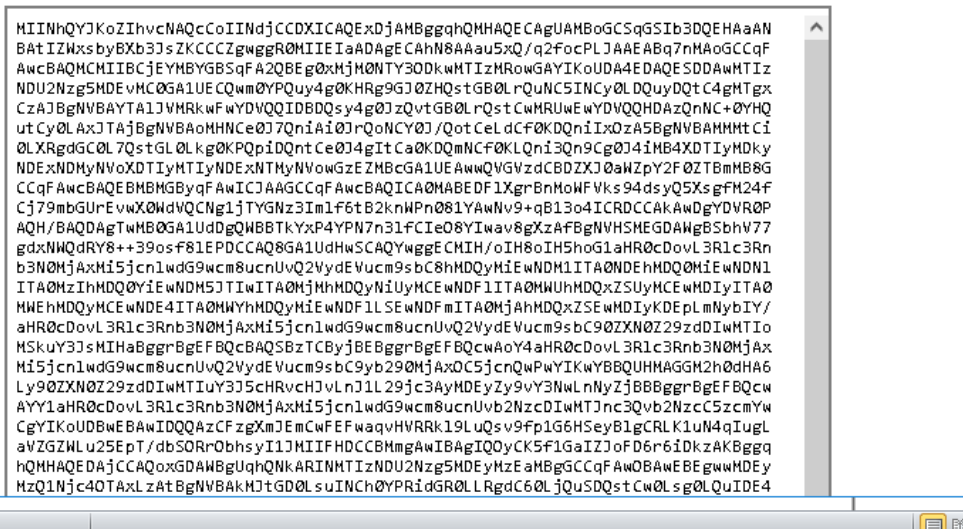
Рисунок 2. Пример тестового сертификата Крипто-Про ГОСТ34.10-2012